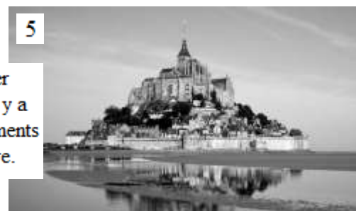
Le Mont Saint Michel en Normandie