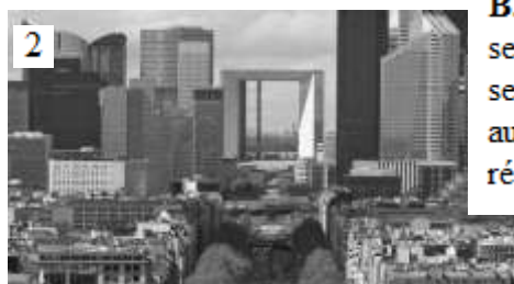
Paris - la Défense