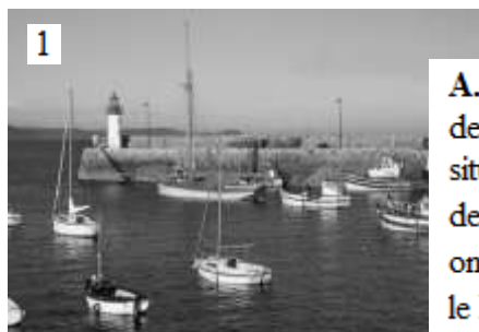
Erquy en Bretagne

Przyjrzyj się zdjęciom przedstawiającym różne miejsca we Francji. Opisy zostały omyłkowo poprzestawiane. Przyporządkuj właściwy opis do każdego z tych zdjęć, wpisując w miejsca obok numerów zdjęć (1-8) odpowiednią literę (A-H).