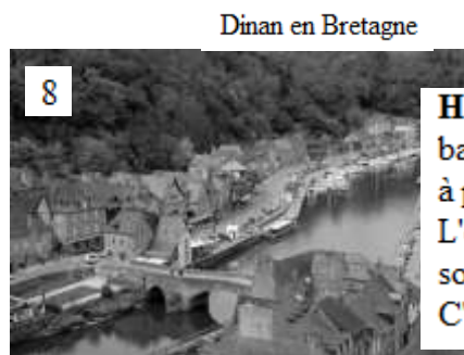
Dinan en Bretagne