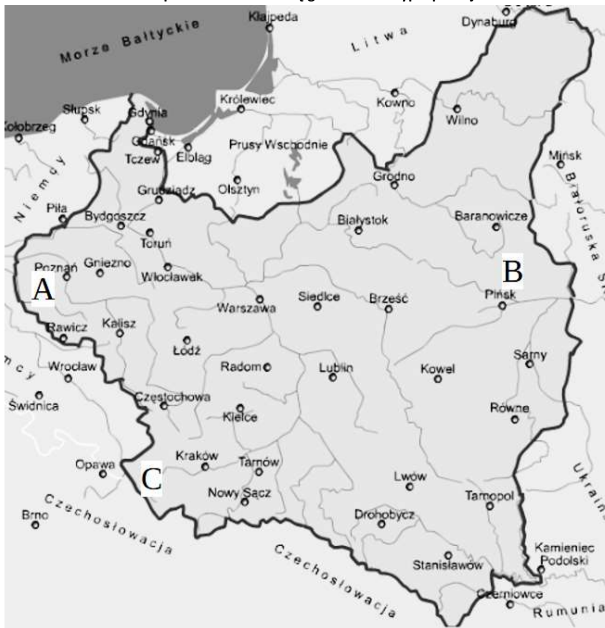
Mapa. Kształtowanie się granic II Rzeczypospolitej

Do podanych opisów (a-d) dobierz właściwe miejsca, oznaczone na mapie literami A, B, C, wpisując ich oznaczenia literowe w wyznaczone miejsca.