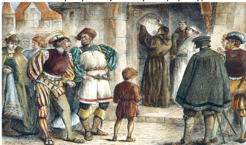
Marcin Luter przybija swoje tezy na drzwiach kościoła w Wittenberdze. Rycina z XIX w.

Na podstawie zamieszczonej niżej ilustracji i własnej wiedzy wykonaj polecenia.